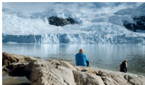
La Glace et le Ciel