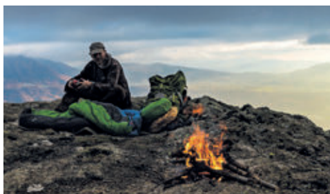
Marche avec les loups