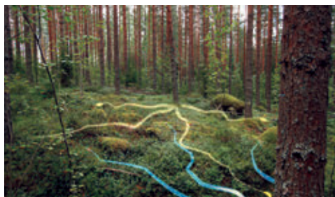
Secrets in the World's Largest Forest

Parcheggio del campo sportivo, strada provinciale per Castelnuovo Nigra