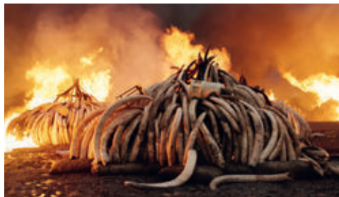
Antropocene: l'epoca umana

Campo sportivo di Alice Superiore - Regione Canapre Superiore