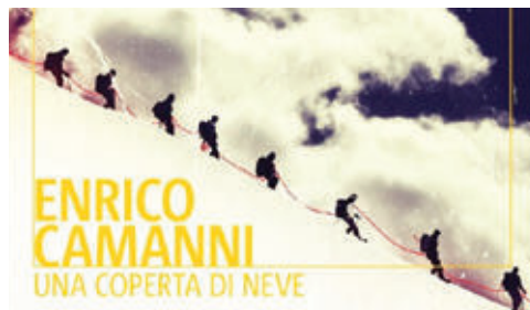
Una coperta di neve

Una "passeggiata" fra le costellazioni del cielo estivo, con la guida di un puntatore laser. Si consiglia un abbigliamento adeguato per l'altitudine.